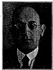
Rb. E. Wedeles

Od 1 do 2%: Běleč (1-8), Bykoš (1-8), Málkov (1-8), Srbsko (1-7), Svinaře (1-7), Bubovice (1-6), Jarov (1-5), Poučnick (1-5), Skuhrov (1-3), Beroun (1-2), Suchomasty-Borek (1-2), Trubín (1-1), Liteň (1-00); Tlustice (1-8), Věradice (1-7), Vižina (1-5), Hořovice (1-2), Osov (1-2).