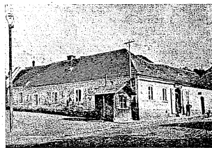
Synagoga v Unhošti (vnějšek)

Tyto tři náb. obce (a s velikým počtem jiných, drobnějších) jsou ode dávných dob v okrese unhošťském, hejmanství kladenském, a jejich vznik byl dobrovolným seskupením nejbližších vesnic a osad za účelem vytvoření možností žid. kulturně-náb. života (zřízení synagogy, školy náboženské, rituální lázně, sechita, chewra kadischa a j.). Blížkost hlavního