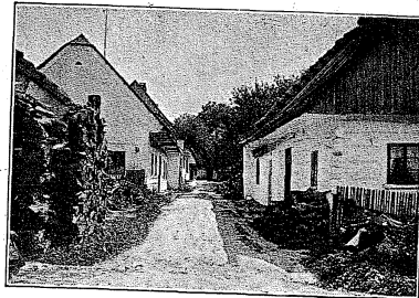
Ehemalige Judengasse in Großbock