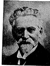
Dir. Hermann Nettl