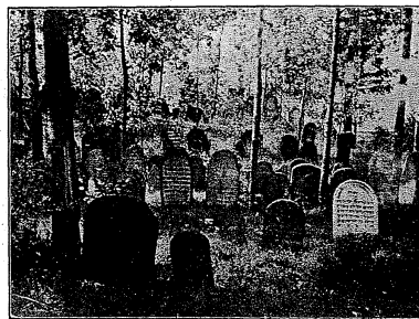
Hořepník (Alter Friedhof)

10 km von Patzau entfernt liegt die heute 1100 Einwohner zählende alte Stadt Hořepník. Einst war sie Sitz einer starken jüdischen Gemeinde und besaß