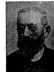
Rb. S. Königsberg