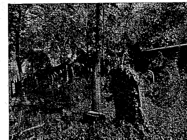
Hřbitov (stará část)